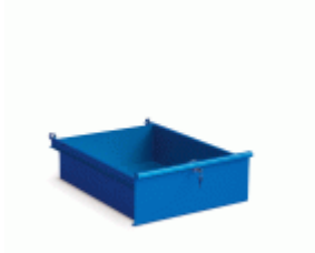
Cajón FAHER para bancos de trabajo